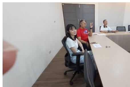
社會學群專任老師