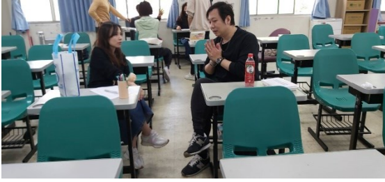
藝術學群專兼任老師