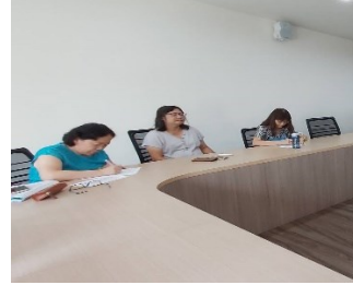
語文學群專兼任老師