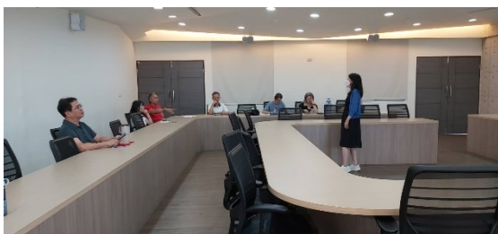
自然學群專任老師