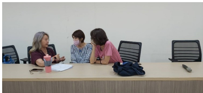
體育學群專任老師