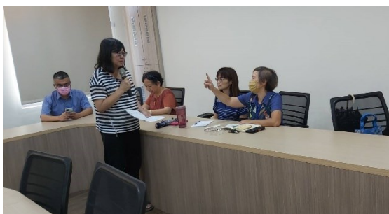
語文學群專兼任老師